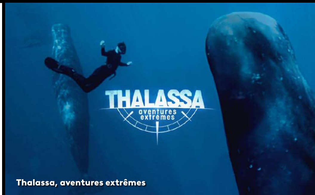
Thalassa, aventures extrêmes