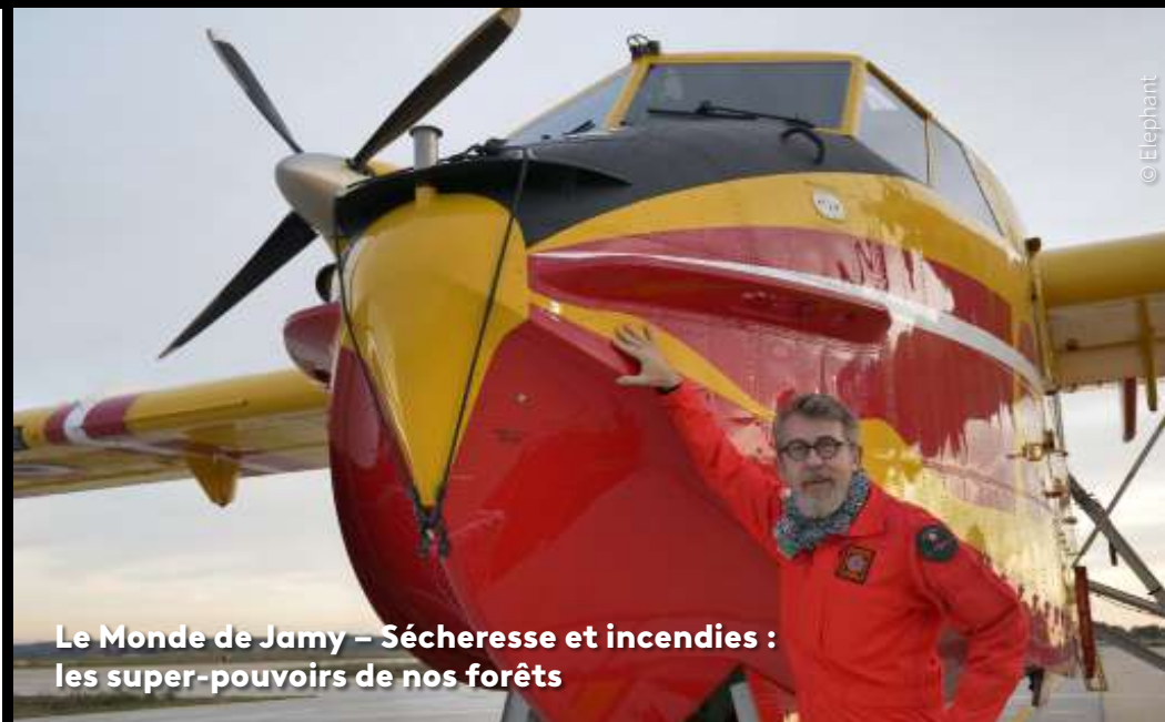
Le Monde de Jamy – Sécheresse et incendies : les super-pouvoirs de nos forêts