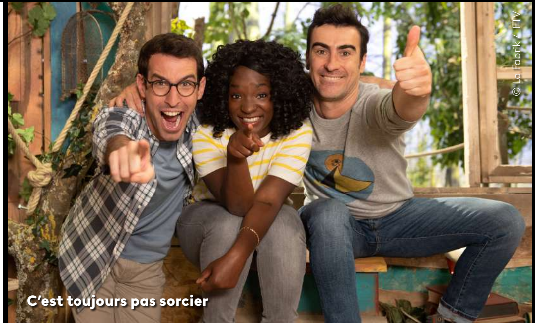
C'est toujours pas sorcier