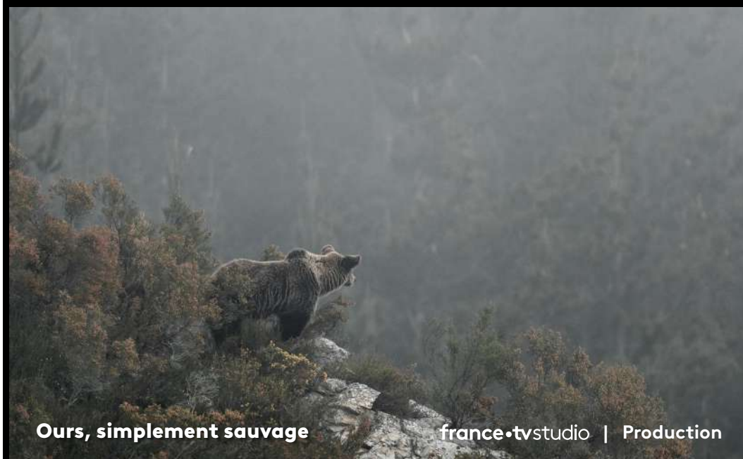
Ours, simplement sauvage