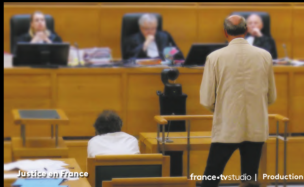
Justice en France