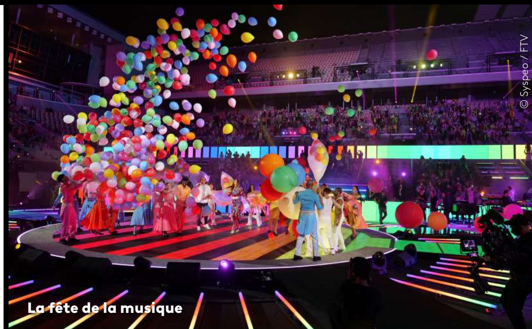
La fête de la musique

Il intervient également lors des grands rendez-vous de l'animation (MIFA à Annecy, Cartoon Forum, MipCom...) en créant les clips et vidéos de présentation projetés lors des conférences de presse.