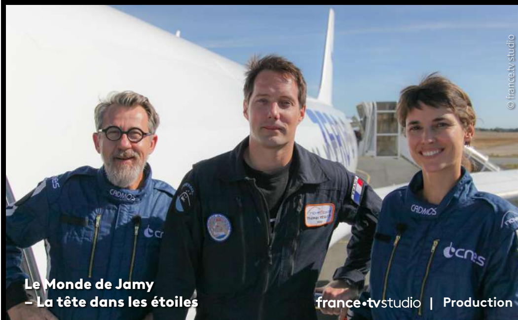
Le Monde de Jamy – La tête dans les étoiles